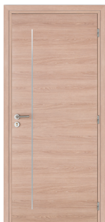
KREATION Line 1V M04