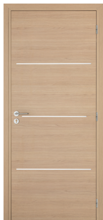
KREATION Line 3H M03A