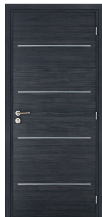
KREATION Line 4H M06