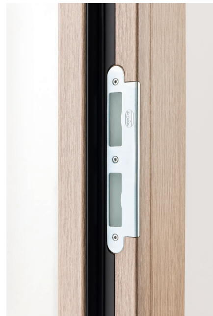
Gâche - Joints intumescent et acoustique