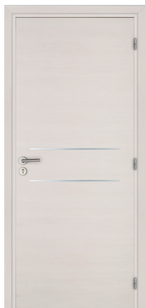
KREATION Line 2H M02