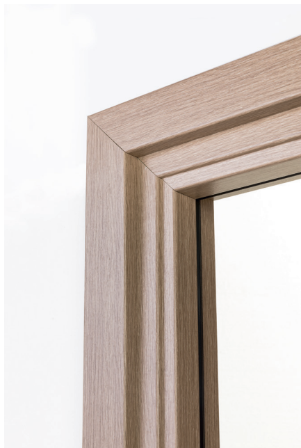
Coupe à 45°