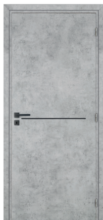
KREATION Line 1H M01