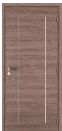
KREATION Line 2V M05