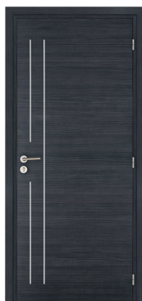
KREATION Line 3V M06