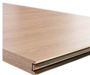
Joint 2 lèvres pour portes Ei30 min Phone 28 et 34 DB